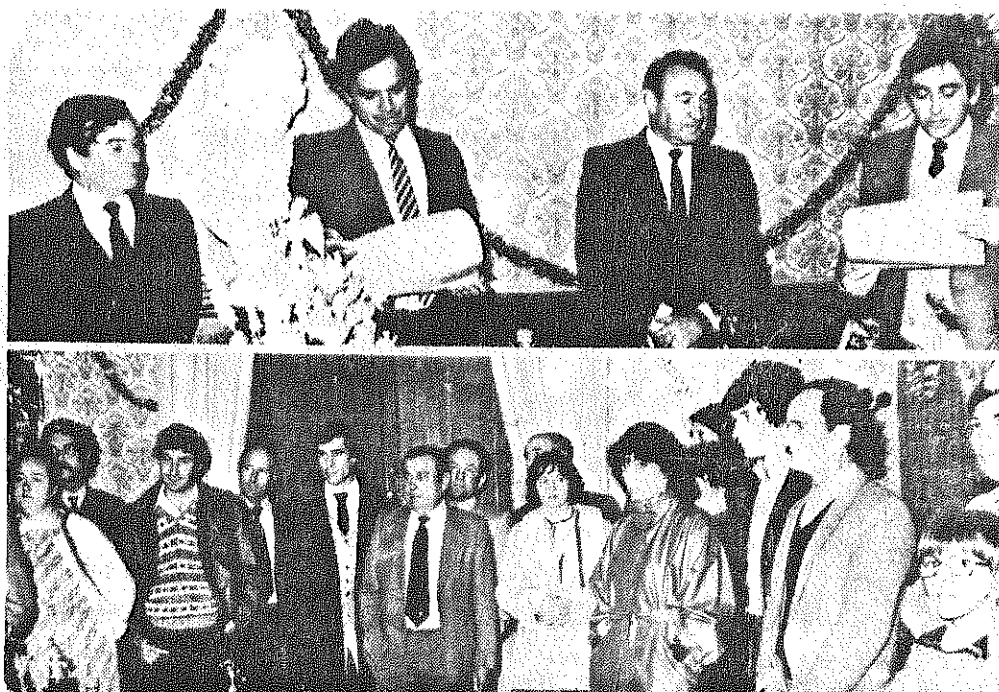
• Les deux maires (en haut) et le groupe breton.